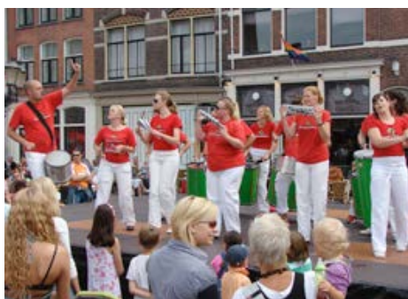
Geen Dias Latinos in 2013