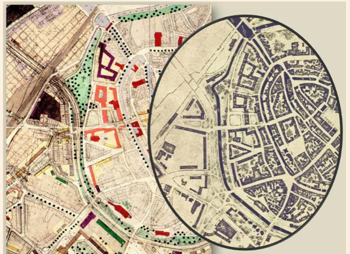
Kaart 2: Stadsring in het Kernplan 1949 (links) en in het Restauratie- en Verkeersplan 1946 (zie kaart 1, maar dan niet ingekleurd).

Uit kostenoverweging is de Rondweg vanaf Monnikendam verplaatst naar het tracé van de Beek (zie kaart 2 voor de verschillen).