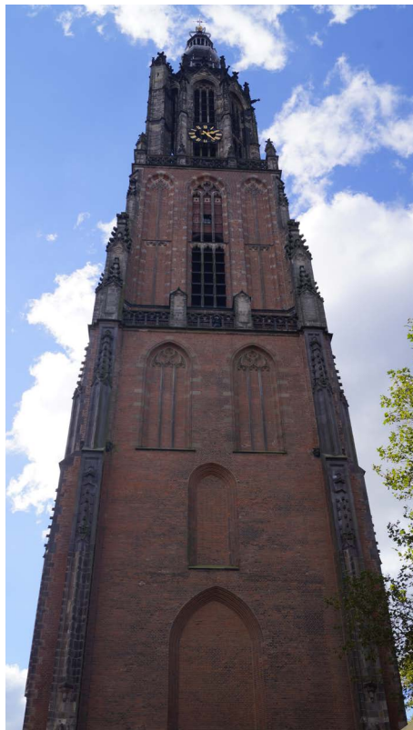
De Onze Lieve Vrouwetoren

Enkele weken geleden ben ik op een dag met goed zicht maar weer eens een stukje de Onze Lieve Vrouwetoren op geklimmen om wat nieuwe foto's van de Amersfoortse binnenstad te maken. Het dakenlandschap van de binnenstad en omgeving blijft fascinerend om te bekijken vanaf de toren. De vraag blijft op welke daken het mogelijk is om zonnepanelen aan te brengen in verband met de verduurzaming van de binnenstad.