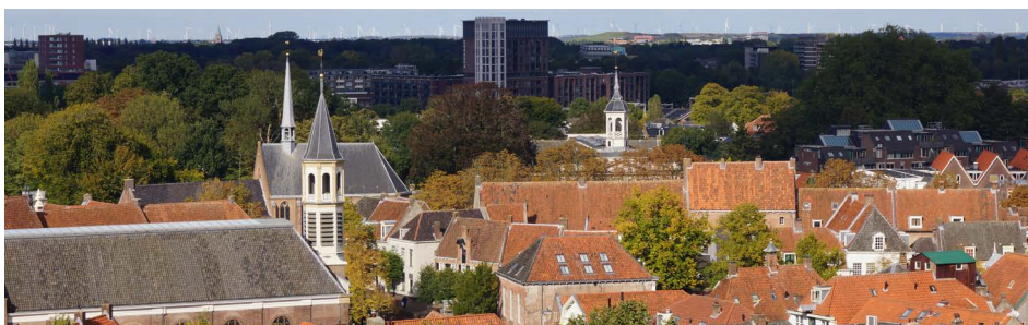
Elleboogkerk, St. Aegtenkapel en torentje van de Xaveriuskerk