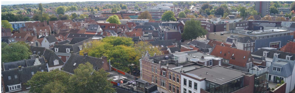
De bomen in het midden staan op de Varkensmarkt. Rechts onder de Westsingel.