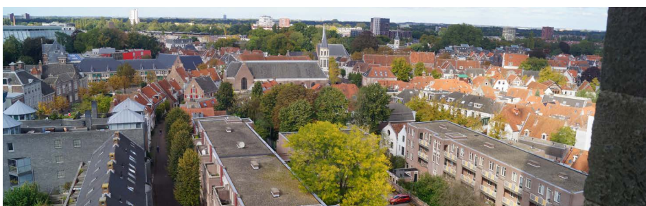
Linksonder de Breestraat en in het midden de Elleboogkerk