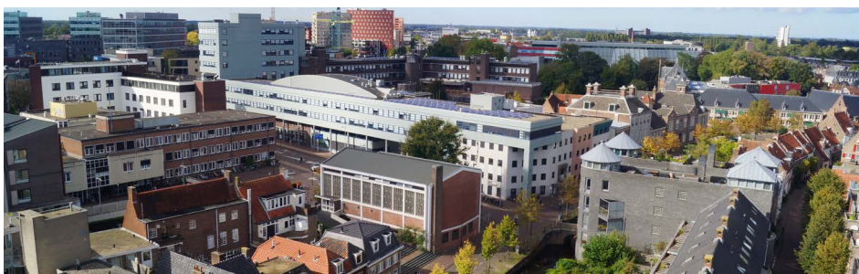
Johanneskerk en Gemeentehuis