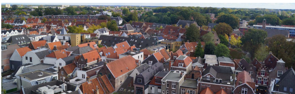
De daken van de panden aan de Langestraat en omgeving.