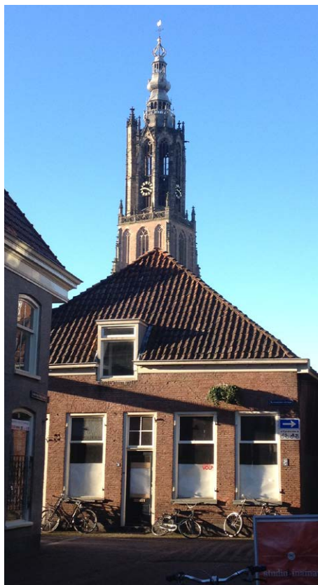
Het pand Krommestraat 32-34

“Als je in een monument woont weet je van tevoren dat er iets te wensen over blijft op het gebied van comfort”, vertelt