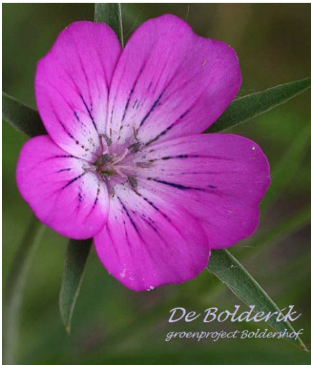
De Bolderik groenproject Boldershof

Bewoners van de Boldershof en de Bloemendalsestraat hebben het initiatief genomen om de stenige Boldershof te vergroenen en te verfraaien. Ze noemen zich De Bolderik en met hulp van de gemeente en adviseurs van 033Groen zijn er al enkele plannen bedacht. Inmiddels doet ook het Platform Water mee, een samenwerkingsverband op het gebied van waterbeheer tussen Waterschap Vallei en Veluwe en de gemeenten in deze regio.