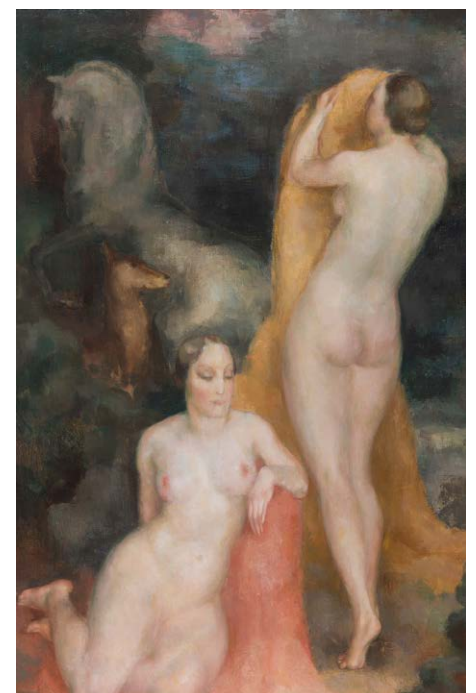
Toon Kelder, Baadsters tegen een donkere achtergrond met steigerend paard en hert.

De tentoonstelling 'Toon Kelder - Romantisch Modernist' laat u kennismaken met een eigenzinnig kunstenaar en zijn artistieke ontwikkeling in al zijn facetten. [AW]