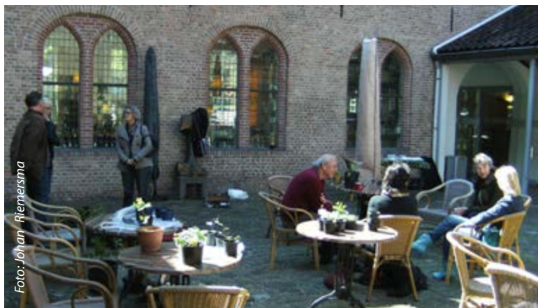
Plantenruilbeurs in de Observant

Het was weer gezellig tijdens de BBN plantenruilbeurs op 19 april op de binnenplaats van Stadscafé De Observant. Het bezoek was redelijk verdeeld over de middag. Eerst waren er vooral halers, daarna ook veel bringers. Plantjes en zaden wisselden van eigenaar en veel verhalen én tips en tricks gingen over tafel. Zoals de mogelijkheden voor stadslandbouw bij De Nieuwe Stad (oude Prodentfabriek), het benutten van nu braakliggend terrein in de binnenstad en natuurlijk de verdere vergroening. De voorzitter van Groei en Bloei kwam langs en misschien gaat het BBN daar volgend jaar een en ander mee afstemmen. Het BBN streeft dus naar een vervolg van de Plantenruilbeurs, met hopelijk meer bringers!