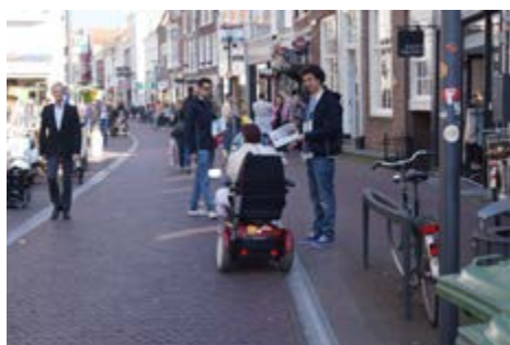
Hinder door colportage in de Langestraat

dacht van deze werkgroep gaan krijgen. Deze werkgroep wil vervolgens in contact treden met andere organisaties in de binnenstad. Meer daarover in een volgende editie van BBN Nieuws.