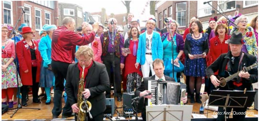
Het koor Rozen en Gladiolen bezingt de heks van de Koppelpoort