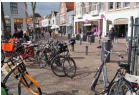
Varkensmarkt: openbare stalling voor fietsen?