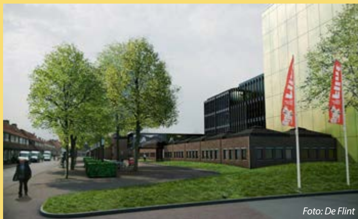
De Flint op een foto-impressie aan de Coninckstraat zijde

De directie van De Flint is bezig met het realiseren van een grondige facelift van de binnen- én buitenkant van het huidige theater. Ook de stadszaal met aanliggende restaurants en foyers ondergaat een metamorfose.