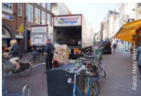
Vracht lossen in de Langestraat, drie rijen dik