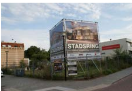
Hoogwaardig stuk grond aan de Stadsring